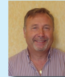
Madame, Mademoiselle, Monsieur, Cher(e) habitant(e) de Bretenière,

Quatre mois après les élections municipales, j'ai le plaisir de vous présenter ce numéro du Petit Journal de Bretenière.